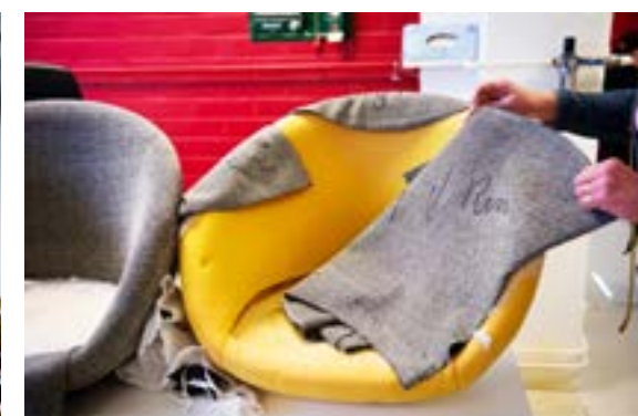
Två fåtöljer väntar på nytt tyg. I stället för att slänga gamla möbler, renoveras och återanvänds de.